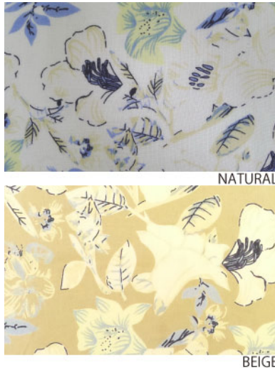
ST3-16030 ワンピース ¥2,500+税 素材:レーヨン100% ブラック ナチュラル ベージュ