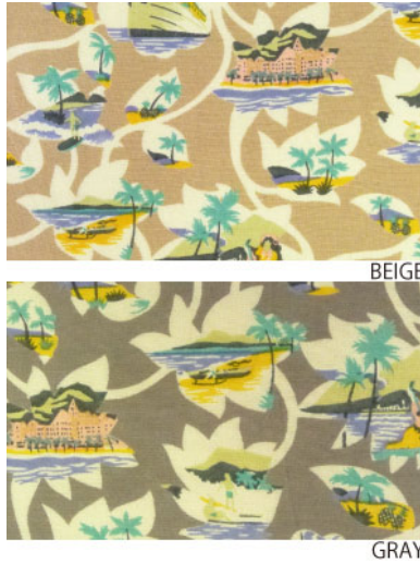
ST3-16028 ワンピース ¥2,500+税 素材:レーヨン100% ネイビー グレー ベージュ