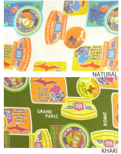
ST3-16029 ワンピース ¥2,500+税 素材:コットン100% ネイビー ナチュラル カーキ