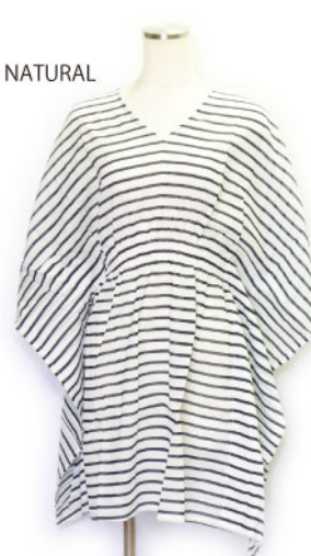
ST3-15106 ポンチョ型チュニック ¥1,900+税 素材:コットン100% 着丈:85cm/裏地なし ネイビー ナチュラル ベージュ