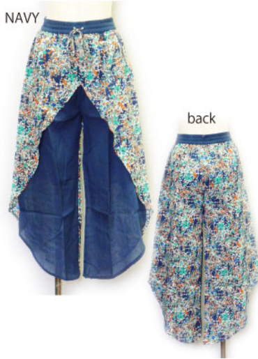
NAVY ST3-15101 パンツ ¥1,900+税 素材:コットン100% 着丈:88cm/裏地あり ネイビー ブラック ブラウン