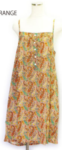
ST3-15102 ワンピース ¥1,900+税 素材:コットン100% 着丈:94cm/裏地なし ベージュ オレンジ ブルー