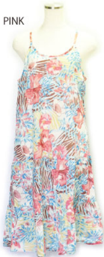
ST3-15103 ワンピース ¥1,900+税 素材:コットン100% 着丈:106cm/裏地あり ナチュラル ピンク ブルー