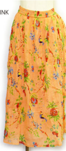
ST3-15104 パンツ ¥1,900+税 素材:コットン100% 着丈:86cm/裏地あり ブラック ナチュラル ピンク