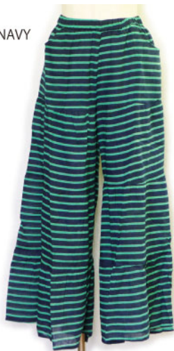
ST3-15105 パンツ ¥1,900+税 素材:コットン100% 着丈:93cm/裏地あり ネイビー ナチュラル ベージュ