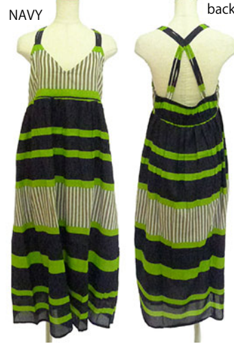
ST2-16013 ワンピース ¥2,500+税 素材:コットン100% ネイビー ブラック グリーン