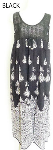
ST2-16014 ワンピース ¥2,500+税 素材:コットン100% ナチュラル ブラック ベージュ