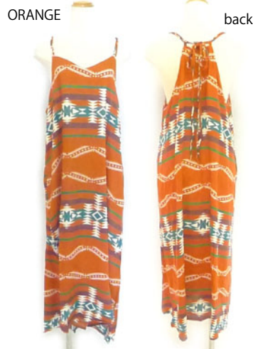
ST2-16018 ワンピース ¥2,500+税 素材:レーヨン100% ブラック ベージュ オレンジ