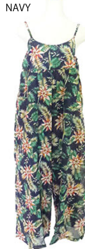
ST2-16015 ワンピース ¥2,500+税 素材:コットン100% ブラック ネイビー ナチュラル