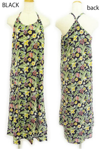
ST2-16011 ワンピース ¥2,500+税 素材:コットン100% ブラック ベージュ カーキ