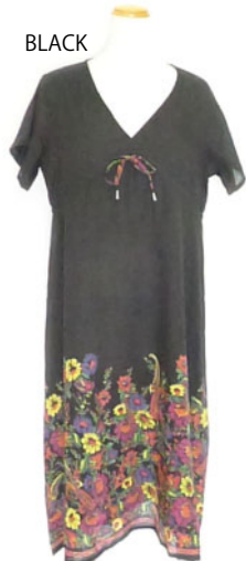
ST2-16019 ワンピース ¥2,500+税 素材:コットン100% ナチュラル ブラック ベージュ