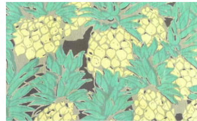
ST2-16020 ワンピース ¥2,500+税 素材:コットン100% ナチュラル ブラック ベージュ