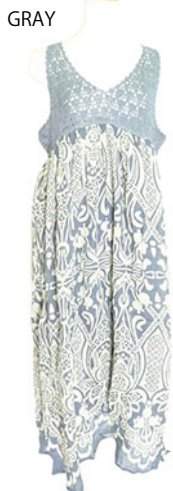
ST2-16017 ワンピース ¥2,500+税 素材:コットン100% ブラック ベージュ グレー