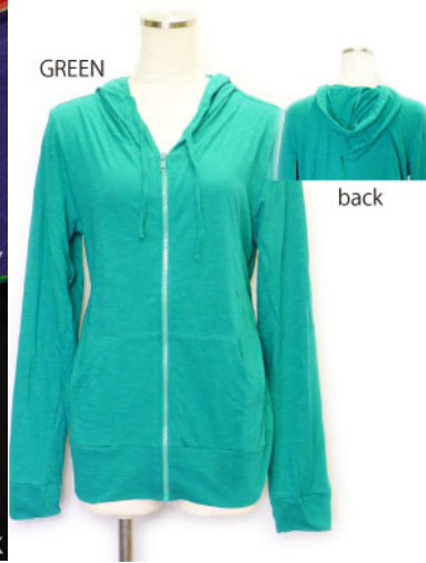
SL3-15141 フード付パーカー ¥1,900+税 素材:コットン100% 着丈:64cm/裏地なし ブラック ピンク グリーン ネイビー L/ピンク