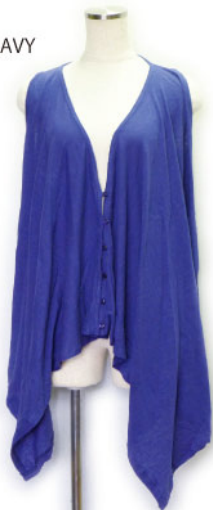
SL3-15145 ベスト ¥1,900+税 素材:コットン100% 着丈:短い60cm 長い86cm/裏地なし ブラック ピンク グリーン ネイビー L/ピンク