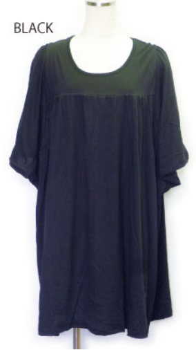
SL3-15144 ワンピース ¥1,900+税 素材:コットン100% 着丈:87cm/裏地なし ブラック ピンク グリーン ネイビー L/ピンク