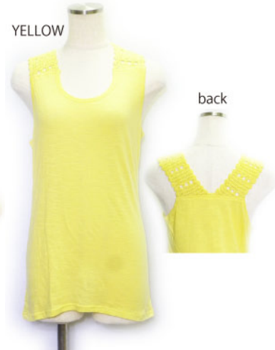
SL3-15150 タンクトップ ¥1,900+税 素材:コットン100% 着丈:65cm/裏地なし ブラック ブルー イエロー グリーン オレンジ