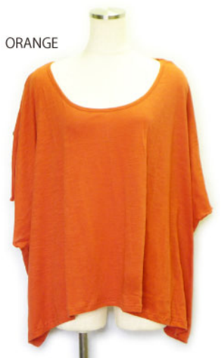
SL3-15148 ポンチョ型ブラウス ¥1,900+税 素材:コットン100% 着丈:64cm/裏地なし ブラック ブルー イエロー グリーン オレンジ