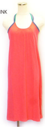
SL3-15142 ワンピース ¥1,900+税 素材:コットン100% 着丈:100cm/裏地なし ブラック ピンク グリーン ネイビー L/ピンク