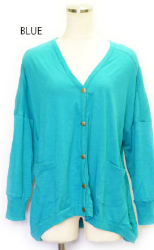
SL3-15146 長袖カーディガン ¥1,900+税 素材:コットン100% 着丈:87cm/裏地なし ブラック ブルー イエロー グリーン オレンジ