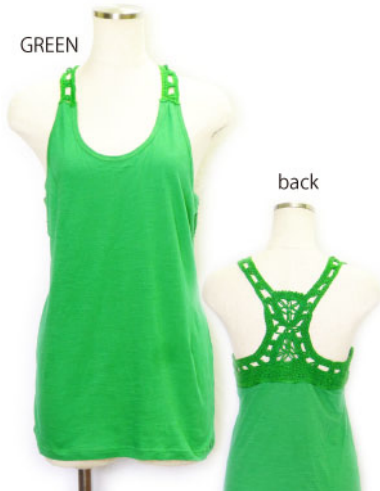
SL3-15149 タンクトップ ¥1,900+税 素材:コットン100% 着丈:62cm/裏地なし ブラック ブルー イエロー グリーン オレンジ