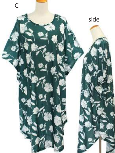
SC18-0008 ブラウス ¥1,980+税 素材:ポリエステル95% ポリウレタン5% A B C D E