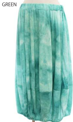
SC18-0011 スカート ¥1,980+税 素材:レーヨン50% ポリエステル50% ブラック パープル カーキ グリーン オレンジ