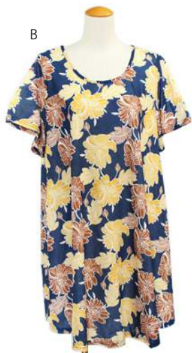
SC18-0009 ワンピース ¥1,980+税 素材:ポリエステル95% ポリウレタン5% A B C D E