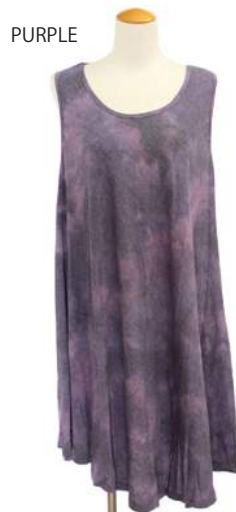
SC18-0010 アンブレラワンピース ¥1,980+税 素材:レーヨン50% ポリエステル50% ブラック パープル カーキ グリーン オレンジ