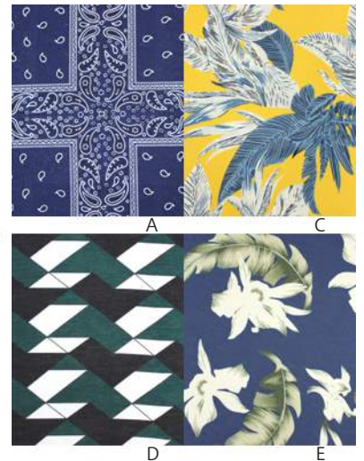
SC19-0002 ブラウス ¥1,980+税 素材:ポリエステル95% ポリウレタン5% A B C D E