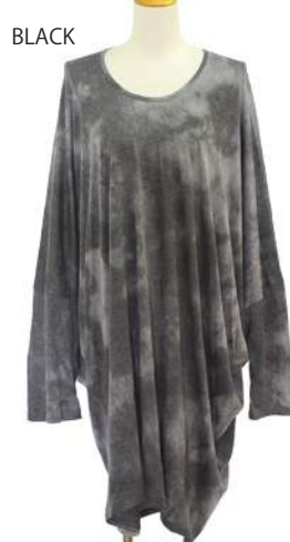
SC18-0012 ブラウス ¥1,980+税 素材:レーヨン50% ポリエステル50% ブラック パープル カーキ グリーン オレンジ