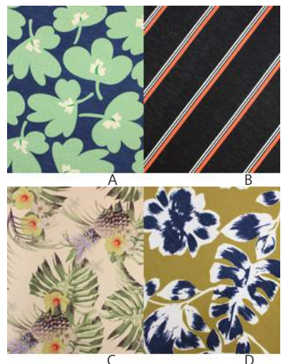
SC19-0004 アンブレラワンピース ¥1,980+税 素材:ポリエステル95% ポリウレタン5% A B C D E