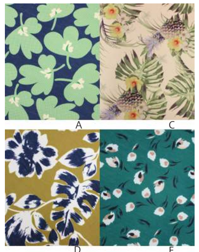
SC19-0006 パンツ ¥1,980+税 素材:ポリエステル95% ポリウレタン5% A B C D E