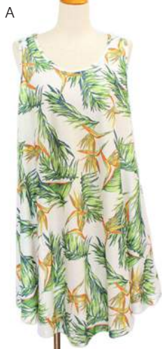
SC18-0007 アンブレラワンピース ¥1,980+税 素材:ポリエステル95% ポリウレタン5% A B C D E