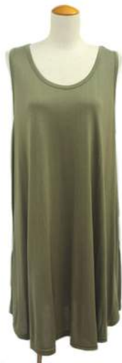
AT-19165 ワンピース ¥1500+税 素材:レーヨン100% アソート