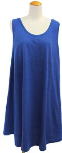
AT-19166 ワンピース ¥1500+税 素材:コットン100% アソート