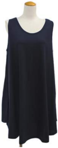
AT-19164 ワンピース ¥1500+税 素材:コットン100% アソート