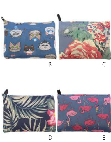
サイズ: バック時 39cm × 58.5cm 収納時 10cm × 14cm