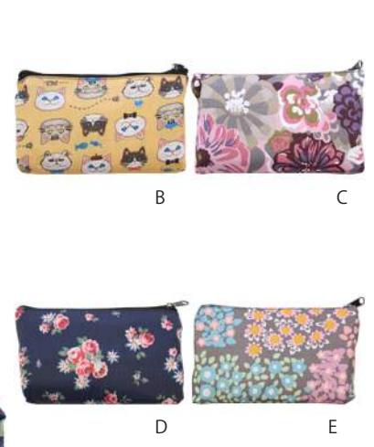
サイズ: バック時 46cm × 50cm 持手 53.5cm 収納時 12.5cm × 20cm ※バックと収納袋は紐で繋がっています。