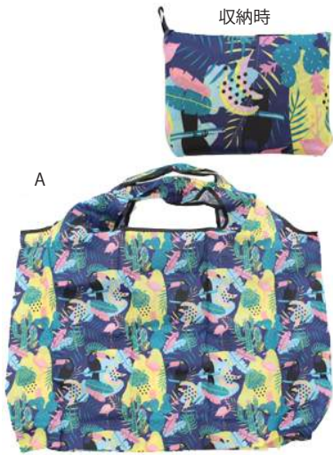
AC18-0029 エコバック ¥500+税 A B C D E