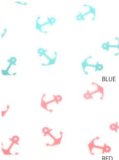
サイズ: 着丈 94.5cm 収納時 24cm × 20cm 持手 31cm