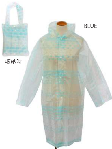
AC18-0031 レインコート ¥1,000+税 レッド ブルー ホワイト グリーン