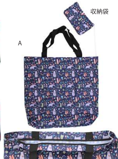
AC18-0030 エコバック ¥650+税 A B C D E