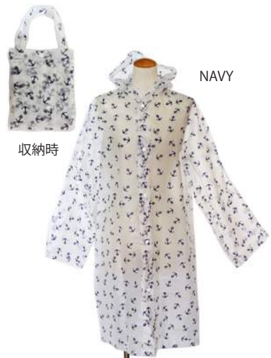
AC18-0033 レインコート ¥1,000+税 ブルー レッド ネイビー