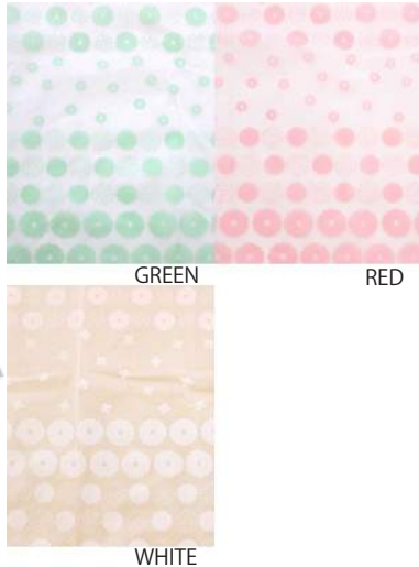
サイズ: 着丈 94.5cm 収納時 22cm × 19cm 持手 34cm