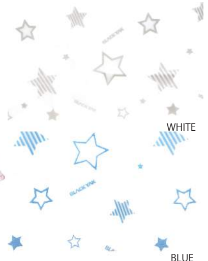
サイズ: 着丈 94.5cm 収納時 23cm × 24cm 持手 34cm