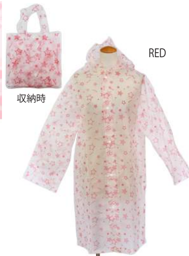
AC18-0032 レインコート ¥1,000+税 ブルー レッド ホワイト